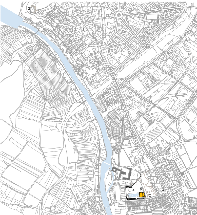
SCHÉMA ŠIRŠÍCH VZTAHŮ MĚSTA ZNOJMA 1: 5000